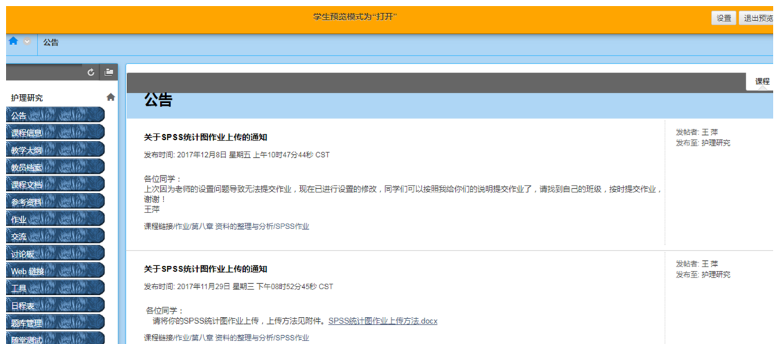
图 1 《护理研究》在线网络课程截图（毕博平台）

有较为成熟的在线课程建设经验。慕课平台的建设核心是优秀资源共享，课程注册人数多才具有意义。目前斯坦福大学一门《人工智能导论》的免费课程注册人数已达 16 万人，国内大学慕课平台的《爱情心理学》的注册人数也能达到 4.8 万人，《护理研究》课程的授课人群以在校本科生和临床护士为主，仅供广东省内注册护士中专科以下的就有近 24 万人，我校年均在校生达 500 人，成教护生年均 6000 人，受众数量庞大，资源共享效益高。