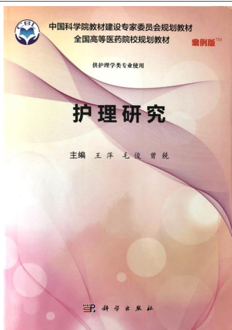
图 2 主编教材：《护理研究》（案例版 2017 年）

2.3.3 该课程以临床案例为主线，对成人护生和临床护士的指导意义大。 该课程以临床护士在科研中遇到的问题为案例，以科研步骤为主线，分章节介绍科研流程，内容包括十二章：护理科研概述；科研选题；医学文献检索；实验性研究设计与方法；观察性研究设计与方法；偏倚及其控制方法；质性研究；收集资料方法；科研资料的整理及分析；护理研究论文的撰写；循证护理；护理科研项目管理。每一章均以案例引出，将案例贯穿始终，强调贴合临床，有助于成人护生和临床护士掌握科研的关键步骤，提升科研能力。课题负责人担任东莞护理学会科研管理工作委员会主任委员，该课题的立项将有助于护理研究在线网络资源的共享和传播。